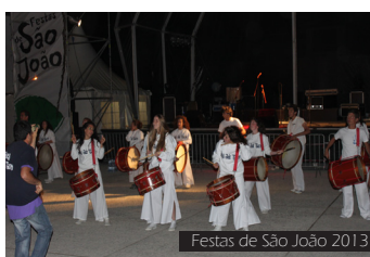
Festas de São João 2013