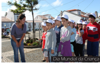
Dia Mundial da Criança