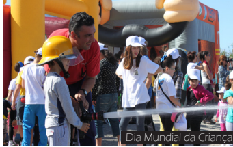
Dia Mundial da Criança