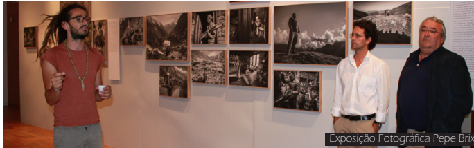
Exposição Fotográfica Pepe Brix