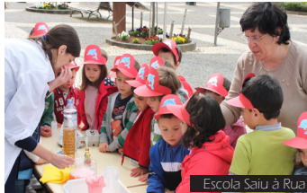
Escola Saiu à Rua