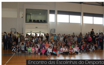
Encontro das Escolinhas do Desporto