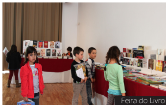
Feira do Livro