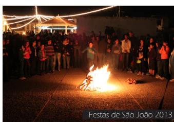
Festas de São João 2013