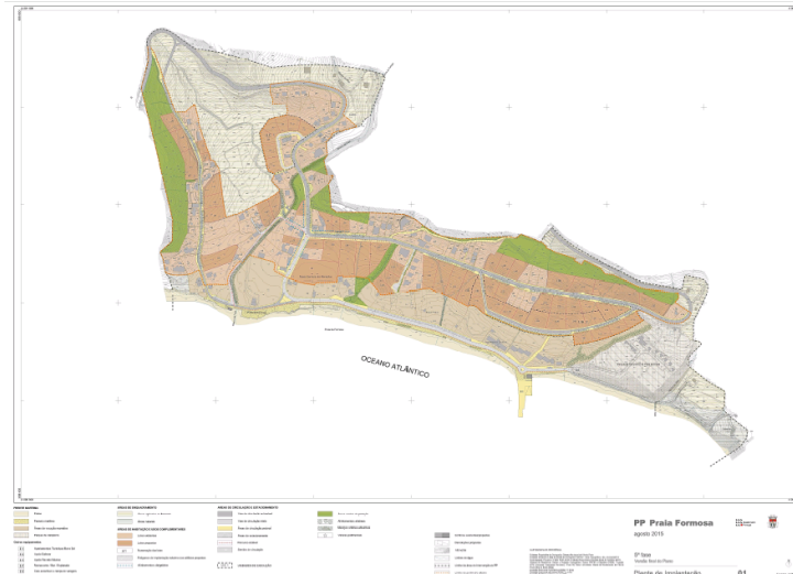
Planta de condicionantes PPPF