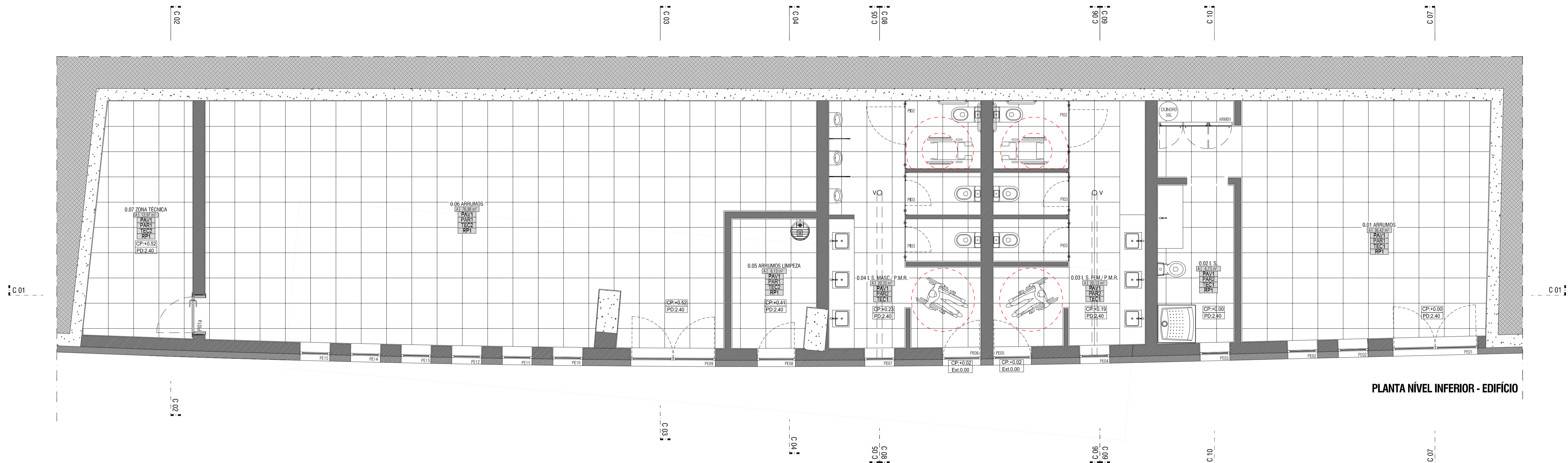
PLANTA NÍVEL INFERIOR - EDIFÍCIO

NOTA: CP - COTA DE PAVIMENTO NO LIMPO 84.59 (TOPOGRÁFICA) = COTA LIMPO 0.00 (ARQUITECTURA) PD - PE DIREITO