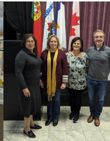
REUNIÃO COM A LIGA SOLIDÁRIA DA MULHER PORTUGUESA EM MANITOBA