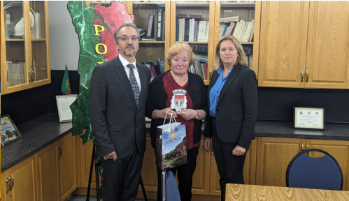
VISITA AO CENTRO CULTURAL PORTUGUÊS DE MANITOBA