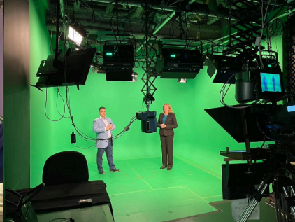
ENTREVISTA AO CANAL PORTUGUES FPTV