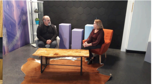
ENTREVISTA NA LUSOCANTV