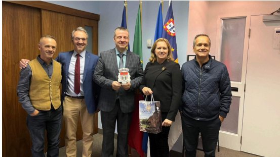
REUNIÃO COM O CONSUL HONORÁRIO DE WINNIPEG