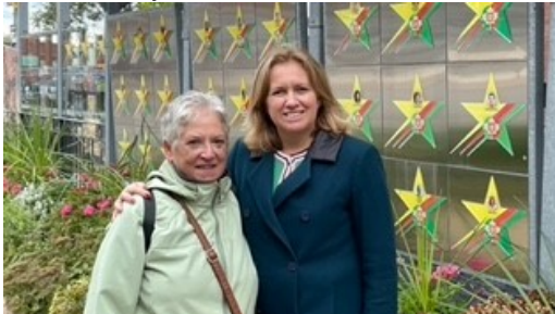
VISITA À ASSOCIAÇÃO UNIDAS