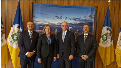
APRESENTAÇÃO DE CUMPRIMENTOS AO MAYOR DE WINNIPEG, SCOTT GILLINGHAM