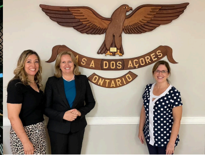
VISITA À CASA DOS AÇORES DE ONTÁRIO