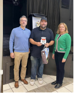
VISITA À CASA DO MINHO