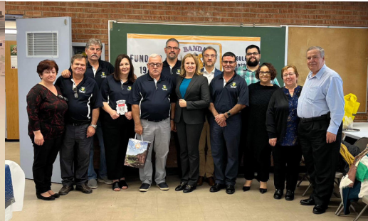
VISITA À BANDA FILARMÓNICA LIRA DE FÁTIMA