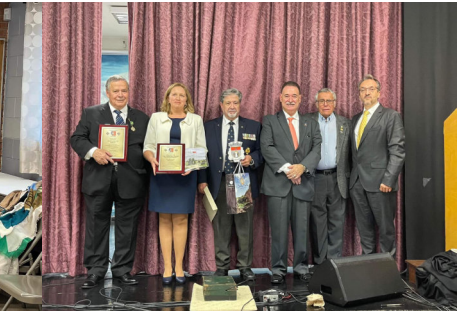
ENCONTRO MARIENSE NA CASA DOS AÇORES