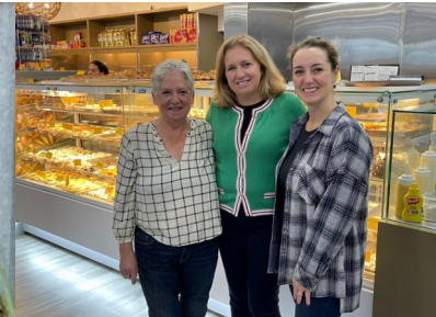
VISITA À PASTELARIA BROCKTON VILAGUE BAKERY