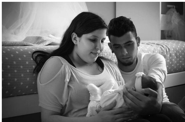
Família Costa - Família são aqueles com quem nos preocupamos e se preocupam connosco e estão sempre ao nosso lado nos bons e maus momentos da vida.