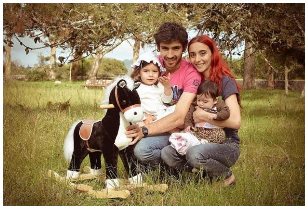
Família Duarte - Talvez não sejam laços de sangue que formam uma família, mas sim o carinho, amor e afeto que criamos.