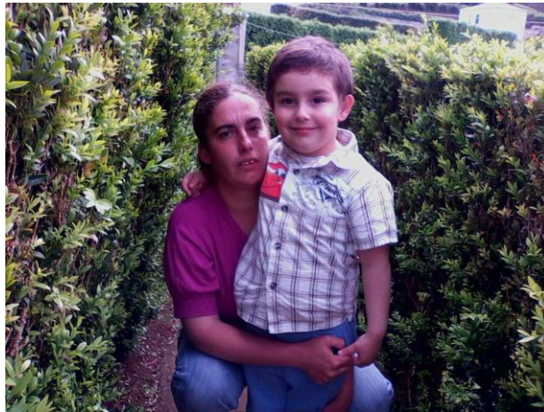
Família Sampaio - A família é o bem mais precioso que temos.