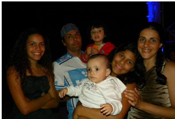
Família Sousa - A verdadeira felicidade está na própria casa, entre as alegrias da família.